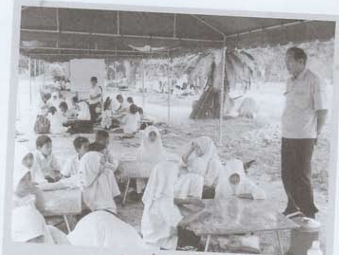
เด็กที่ช่วยควรวางที่เด็กๆ ให้เรียนหนังสือ