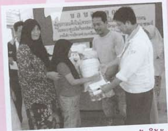
เจ้าหน้าที่มูลนิธิฯ มอบข้าวสาร อาหารแห้ง ให้กับ ครอบครัวที่ได้รับผลกระทบ

ท่ามกลางสถานการณ์ที่รุนแรงนี้ มูลนิธิฯ ยืนยันว่าเจ้าหน้าที่ และอาสาสมัครผู้เสียสละจะยังคงทำงานเพื่อช่วยเหลือเด็กในพื้นที่ อย่างแข็งขันต่อไป เพื่อบรรเทาวิกฤตของเด็กและครอบครัวที่ได้รับผล กระทบจากความรุนแรงภาคใต้ แต่มูลนิธิฯ ไม่สามารถทำงานเพียง ลำพังได้ จึงขอเชิญชวนให้คนไทยทุกคนร่วมบริจาคเงินเพื่อนำความ ช่วยเหลือไปสู่เด็กและครอบครัวที่กำลังเสียชีวิต ให้เขามีกำลังใจ กำลังใจที่เข้มแข็งในการต่อสู้กับสถานการณ์ที่โหดร้ายนี้ต่อไป