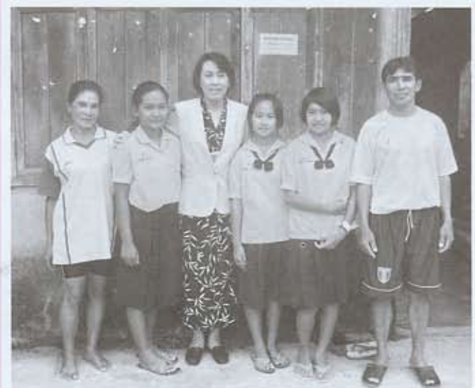
ในภาวะที่แสนทุกข์และหวาดกลัว น้ำใจของท่าน นำพาฝันและรอยยิ้มของผู้ทุกข์ยากกลับคืนมาอีกครั้ง