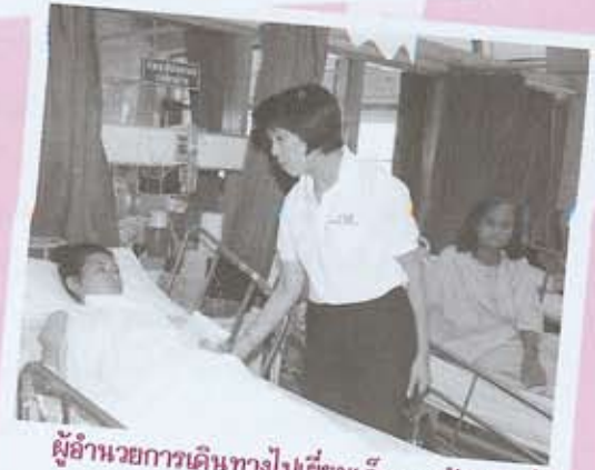
ผู้อำนวยการเดินทางไปเยี่ยมเด็กและเจ้าหน้าที่ฯ ที่ถูกอบทำร้าย